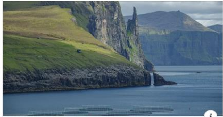
BIOENERGY-NEWS.COM Faroeese salmon firm wins award for archipelago's first biogas project

Also in faero it start https://www.bioenergy-news.com/.../faroe-salmon-company-wi.../whit bio Metan but not yet for transport! 🙌🙌