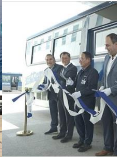
Metan - íslenskt ökutækjaeldsneyti Motor Vehicle Company

Ári nýl htt Metan - íslenskt ökutækjaeldsneyti Published by Björn H. Halldórsson [?] 120 nýjir metanvagnar frá Hunday teki http://www.ngvjournal.com/.../traxion-p