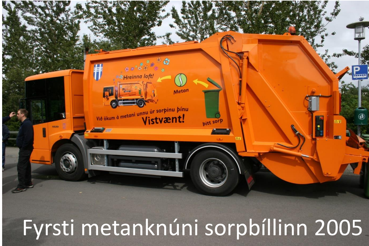
Fyrsti metanknúni sorpbíllinn 2005